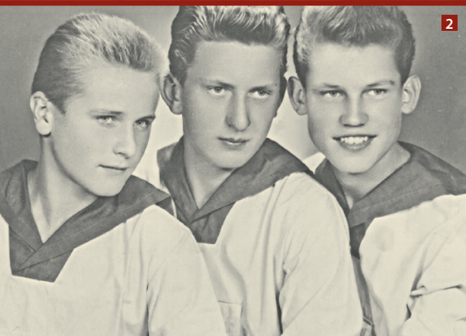
1 • Vlašim 2021